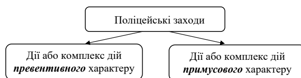
Схема 1. Види поліцейських заходів

Для забезпечення охорони громадського порядку (далі - ОГП) та публічної безпеки (тобто підтримання нормальних умов життєдіяльності для всіх членів суспільства) Закон України (далі - ЗУ) «Про Національну поліцію» (далі - НП) встановлює правові підстави для застосування поліцейських заходів (розділ V. Поліцейські заходи, статті 29 вищезазначеного ЗУ «Про НП»), під котрими розуміємо дії або комплекс дій превентивного або примусового характеру, що обмежують певні права і свободи людини та застосовується працівниками поліції відповідно до закону для забезпечення виконання покладених на поліцію повноважень [2] (див. схему 1):