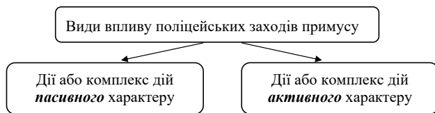
Схема 4. Види впливу поліцейських засобів примусу на особу в залежності від інтенсивності їх використання

На нашу думку, на відміну від активного застосування вогнепальної зброї чи засобів активної оборони при «пасивному» (нижчому рівні активності, в багатьох випадках в штатних ситуаціях) способі їх застосування або використання ці обставини мають такі особливості: 1) не настають суттєві наслідки для життя та здоров'я особи (наприклад, поліцейський не ставить перед собою мету цілеспрямовано нанести смертельні поранення чи травми середньої тяжкості (важкі тілесні ушкодження) людині, проти котрої буде використана зброя на ураження. Виняток становлять тварини, котрі можуть бути знешкоджені в разі створення ними загрози життю чи здоров'ю особі чи поліцейському (у відповідності до статті 180 Цивільного кодексу України тварини є особливим об'єктом цивільних прав, на них поширюється правовий режим речі, крім випадків, встановлених законом) [8]; 2) вмотивовано не завдається значна матеріальна шкода навколишньому природному середовищу (дерева, кущі тощо) чи штучним об'єктам довкілля (будівлі, споруди, АЗС, транспортні засоби тощо); 3) у поліцейського є час для попередження правопорушника про намір застосування зброї.