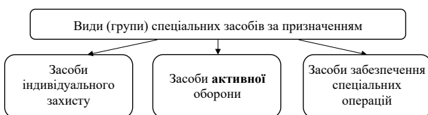
Схема 3. Загальна класифікація спеціальних засобів, котрі перебувають на озброєнні органів та підрозділів Національної поліції України

Термін «активний» зустрічається як при визначенні видів (груп) спеціальних засобів (маємо на увазі засоби активної оборони ), так і при застосуванні вогнепальної зброї (п. 10 статті 46 ЗУ «Про Національну поліцію» [2]: «Поліцейський зобов'язаний у письмовій формі ... негайно повідомити свого керівника про активне застосування вогнепальної зброї, який, у свою чергу, зобов'язаний поінформувати центральний орган управління поліції та відповідного прокурора»). Зокрема, за традиційною класифікацією спецзасоби поділяються на такі групи (див. схему 3):