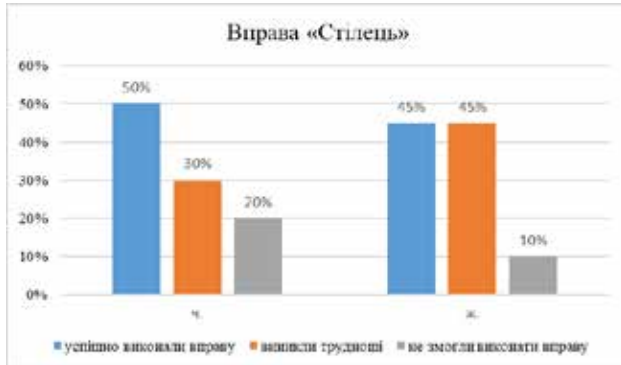
Графік 3. Графік результатів вправи «Стілець»

стимулюючи природне тремтіння простим і безболісним чином, звільнячись від глибокого хронічного напруження в тілі, породженого шоком або травмою.