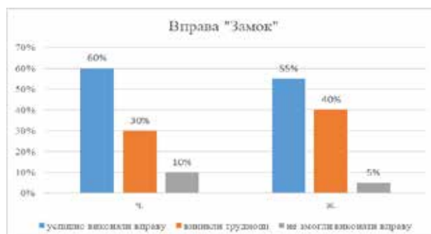
Графік 2. Графік результатів вправи «Замок»

Респондентам запропоновано взяти у замок на потилиці обидві руки і нахилити тіло трішки назад. Або інший варіант даної вправи: взятись однією рукою за потилицю. Усі показники виконання даної вправи зображено у графіку (див. графік 2).