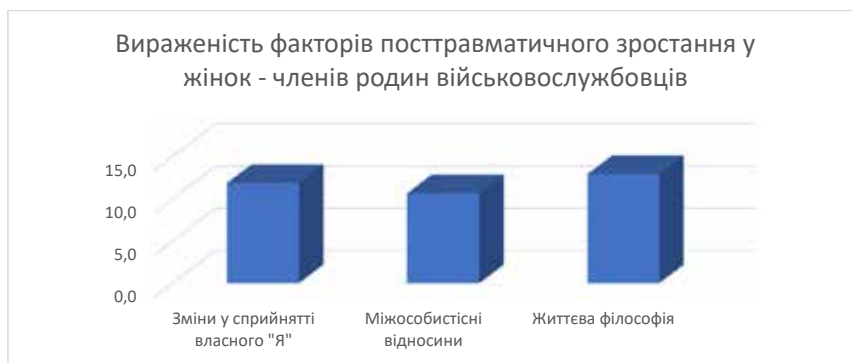
Рис. 2. Аналіз прояву трьох сфер вияву посттравматичного зростання серед жінок - членів родин військовослужбовців

Для детального відображення структури прояву особистісного зростання жінок-членів родин військовослужбовців було проведено якісний аналіз відповідей досліджуваних за шкалою позитивних змін «Опитувальника змін у поглядах» (рис. 4).