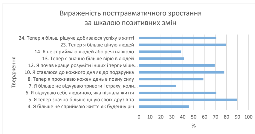
Рис. 4. Аналіз вираженості посттравматичного зростання за шкалою позитивних змін методики «Опитувальник змін у поглядах»

Але, при цьому, разом з проявом посттравматичного зростання серед досліджуваних, слід зазначити, що окремі респонденти також повідомляли про негативні зміни у поглядах на життя (рис. 5).