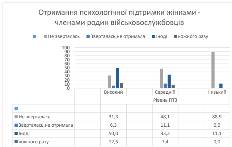
Рис. 6. Аналіз рівня отриманої психологічної підтримки жінками - членами родин військовослужбовців

закінчення страждання чи болю. Багато осіб, які зазнали руйнівних трагедій, здатні сформувати відчуття особистісного зростання з власної напруженої боротьби, однак такий кінцевий результат (зростання) не говорить про те, що вони розглядають травматичну подію як бажане явище [7].